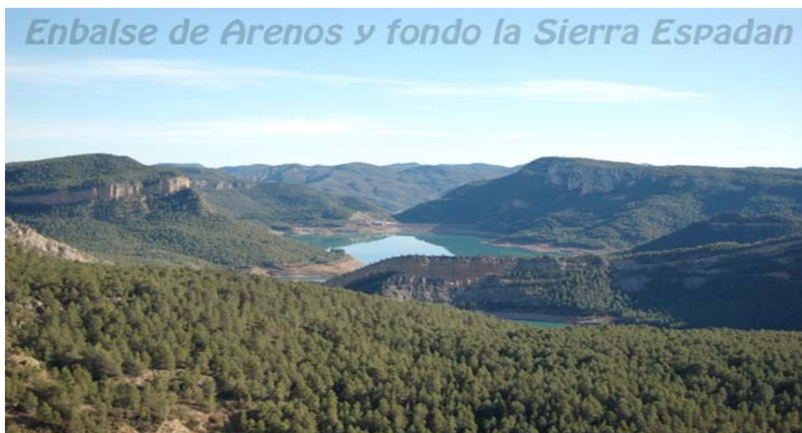
Embalse de Arenos y fondo la Sierra Espadan

Manteamiento y gestión del área en favor de la dinámica económica de la comarca en la actualidad de muy limitado desarrollo.